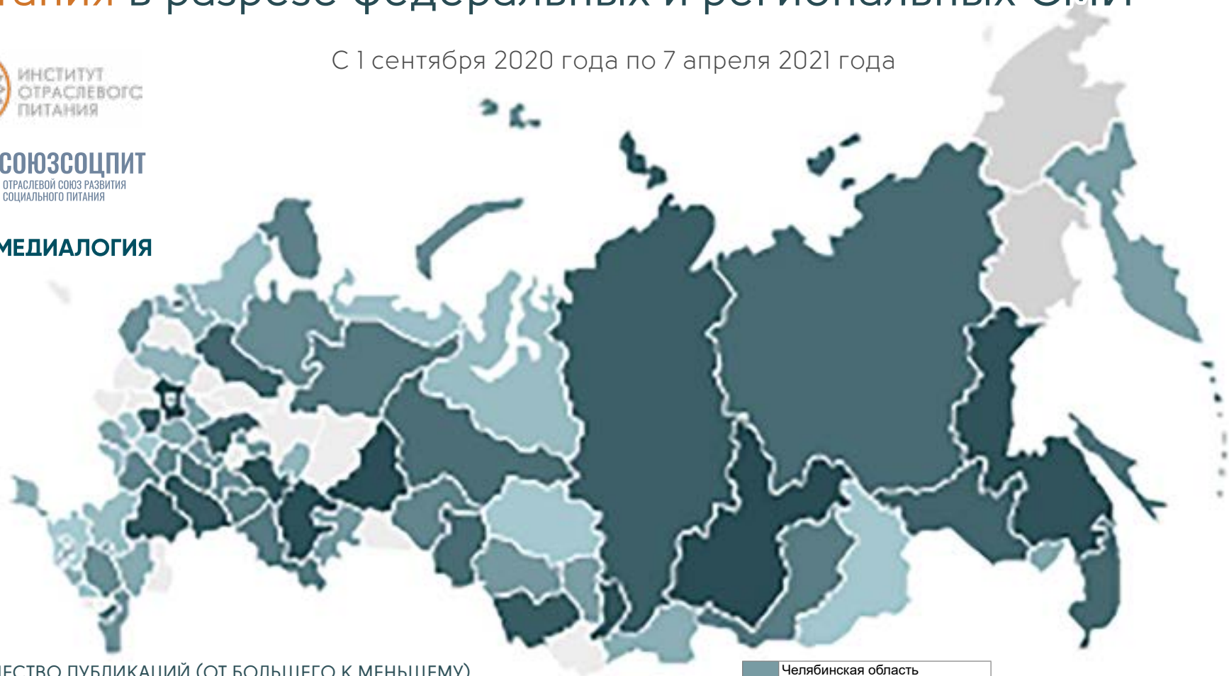
КОЛИЧЕСТВО ПУБЛИКАЦИЙ (ОТ БОЛЬШЕГО К МЕНЬШЕМУ)